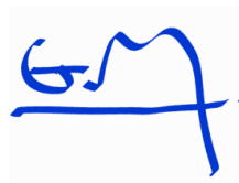
ARQ. GABRIEL AGRAFOJO